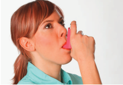
المصدر: Zeichnungen ÄZQ; Foto Kirchheim-Verlag;